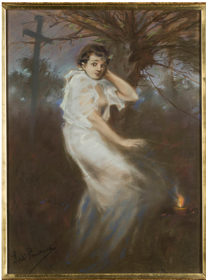
Witold Pruszkowski, Zaduszki. Godzina duchów